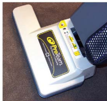
ASPIRAR (SI ESTÁ SECO)