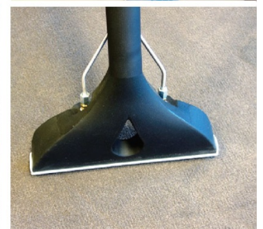
EXTRAER (SI ES NECESARIO)