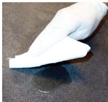
ABSORBER (SI ESTÁ MOJADO)